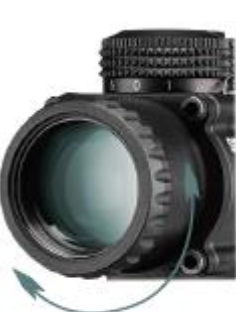
Adjust the reticle focus.