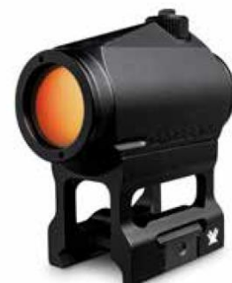
High Mount / Lower 1/3 Co-Witness